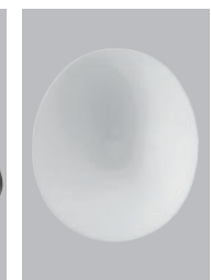
S-6ストレッチロール ¥1,000- [税抜価格]