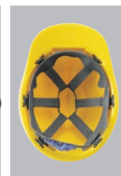
SS66VNR内装 ●ラチェット式調整