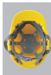
S-62R内装 ●ラチェット式調整