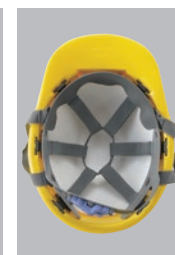
SS66VNR内装 ●ラチェット式調整 ●ストレッチロール