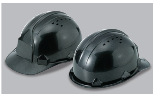
ガラスブレイク塗装 (塗装代別途)