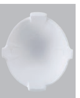
HM-1スチロール ¥1,000- [税抜価格]