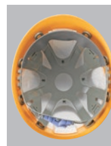
F-2-O-R内装 ●ラチェット式調整 ●スチロール