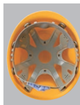
F-2-O-R内装 ●ラチェット式調整