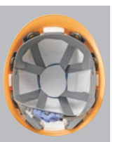
FM-6VN内装 ●ラチェット式調整 ●スチロール