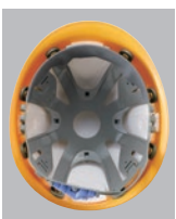
F-2-O-R内装 ●ラチェット式調整 ●スチロール