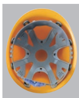
F-2-O-R内装 ●ラチェット式調整