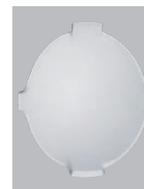
HM-1スチロール ¥1,000- [税抜価格]