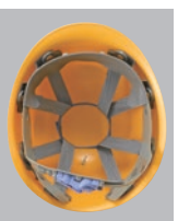
FM-6VN内装 ●ラチェット式調整