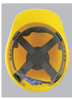
SS-16VR内装 ●ラチェット式調整