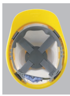
SS-16VR内装 ●ラチェット式調整 ●スチロール