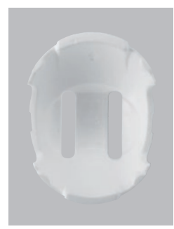
S-16Vスチロール ¥1,000- [税抜価格]