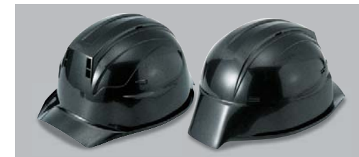
ガラスブレイク塗装(塗装代別途)