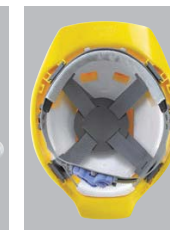
SS-18VRA内装 ●ラチェット式調整 ●タオルバンド ●スチロール