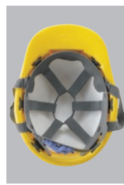
SS66VNR内装 ●ラチェット式調整 ●ストレッチ