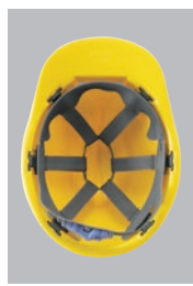
SS66VNR内装 ●ラチェット式調整