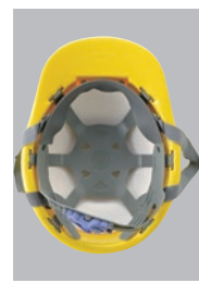
S-62R内装 ●ラチェット式調整 ●ストレッチ