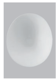
S-6ストレッチロール ¥1,000- [税抜価格]