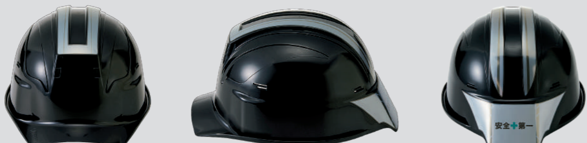
SS-18ME ステッカー ※SS-18V 型専用ステッカー