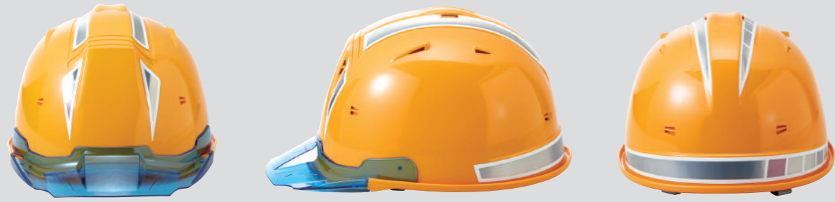
SS-19V-ME ステッカー ※SS-19V 型専用ステッカー