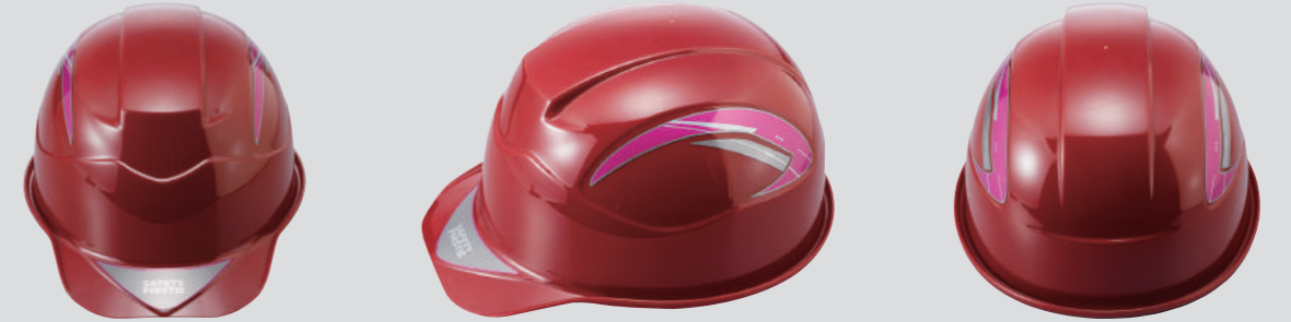
SS-15ME ステッカー ※SS-15 型専用ステッカー