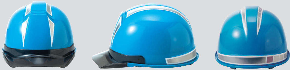
SS-19ME ステッカー ※SS-19 型専用ステッカー