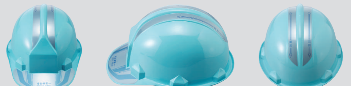
SS-66ME ステッカー ※SS-66 型専用ステッカー